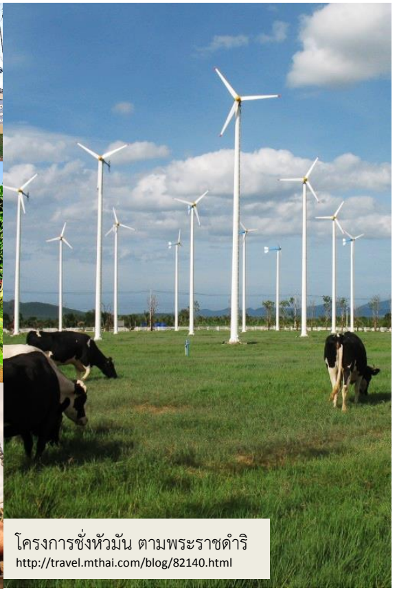
โครงการขังห้วมัน ตามพระราชดำริ http://travel.mthai.com/blog/82140.html