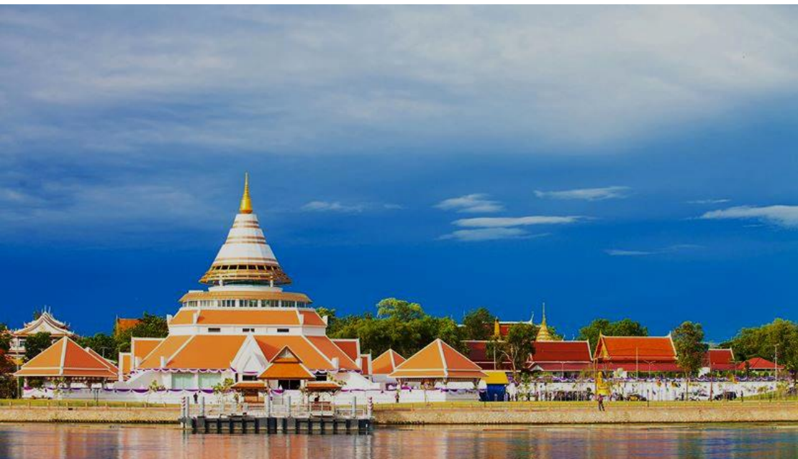
หอพระประวัติสมเด็จพระญาณสังวร สมเด็จพระสังฆราช สกลมหาสังฆปริณายก

http://www.myfirstbrain.com/main_view.aspx?ID=93785